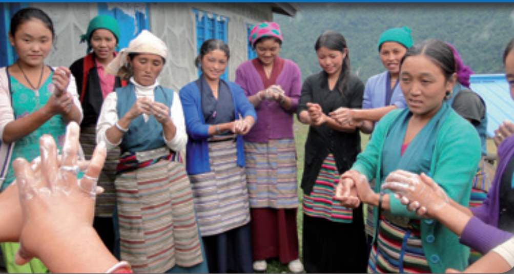
Frauen in Chepuwa – im Hygienetraining wird Händewaschen geübt.