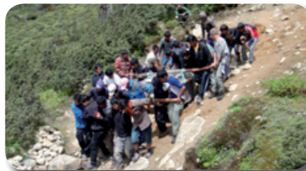
Oben: Der Transport der Verbrennungsanlage nach Namche Bazar erfolgte mit dem M17-Hubschrauber und auf dem Rücken von 20 Trägern.