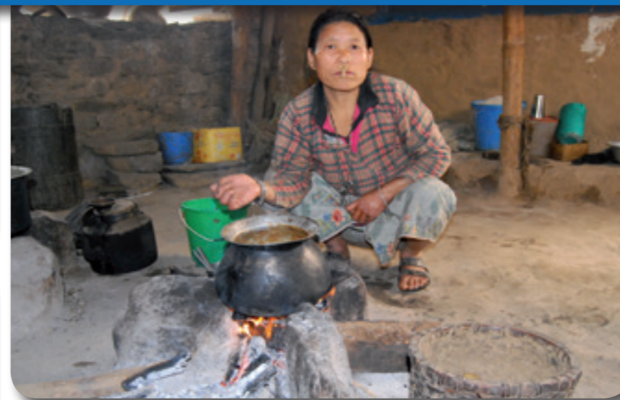
Oben: Gekocht wird in Nepal meist auf offenen Feuerstellen. Unten links: Ein neuer Kochherd (Improved Cooking Stove) aus Lehm. Unten rechts: Kochen ist an den neuen Herden viel einfacher.

Die wirtschaftliche Krise und die exorbitanten Preiserhöhungen in Nepal führen jetzt aber dazu, dass die weitere Finanzierung aller Schüler/innen in Frage steht. EcoHimal hat in den letzten Jahren sämtliche Rücklagen aus eigenwirtschaftlicher Leistung