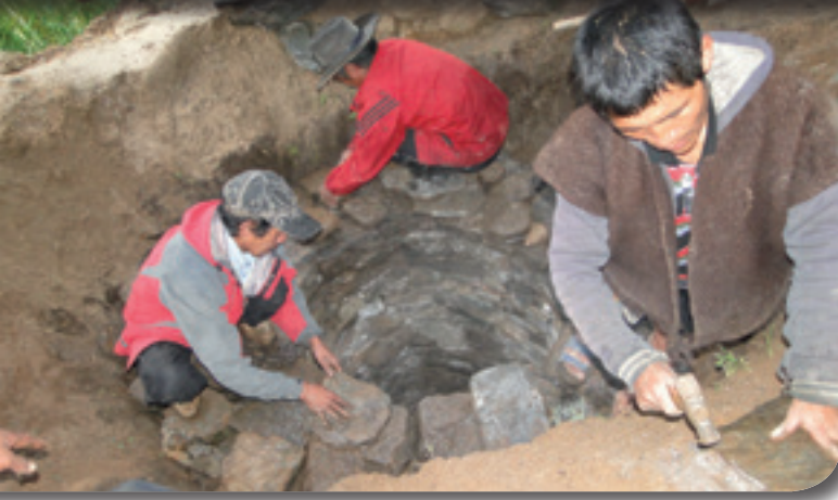
Toilettenbau in Chepuwa – die Senkgrube wird mit behauenen Steinen ausgekleidet.